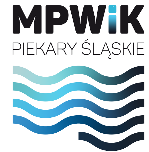
wersja pionowa z dopiskiem